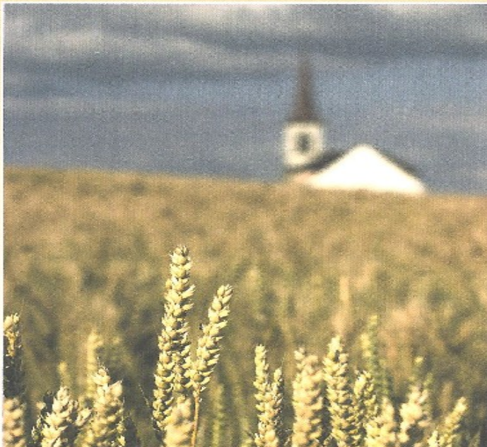
Eine die Kirche wie das Brot aus Korn