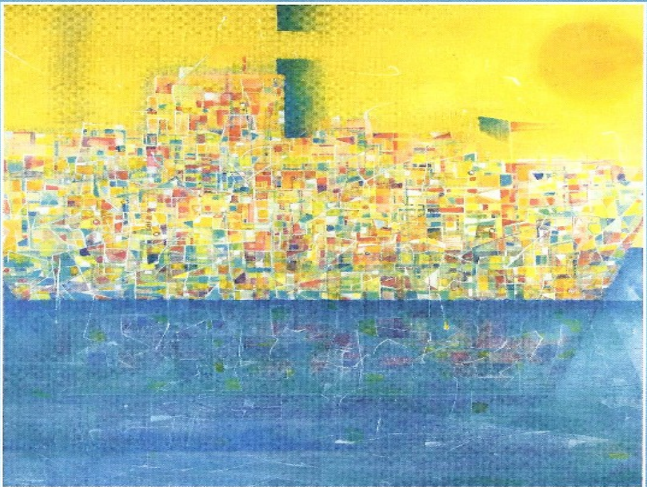
Ein Schiff, das sich Gemeinde nennt © Mariana Lepodius, Lutherstraße 11a, Elseltern, www.lepodius-kunst.de