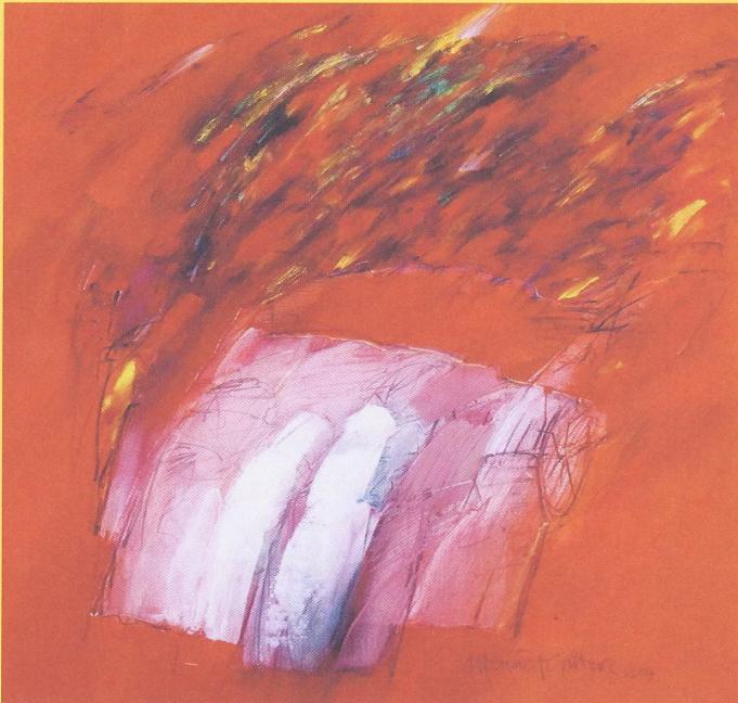
Mehmet Güler, DEINE SONNE, Öl (Original: 140 x 50 cm) 2009